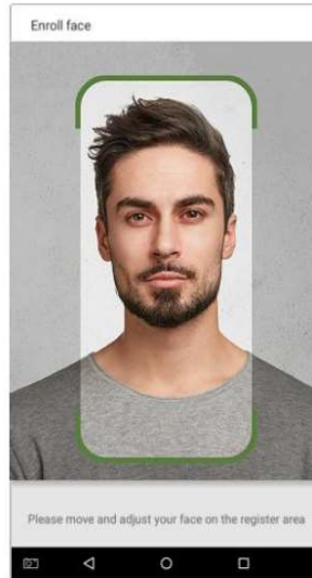
Image1 Face Capture Area